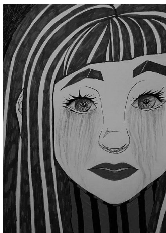
Ilustrace: Natali Santini

Istanbulská úmluva, přesněji Úmluva Rady Evropy o předcházení a potlačování násilí proti ženám a domácího násilí (ETS No. 210, 2011), vyvolává poměrně živou diskusi mezi odborníky i v širší veřejnosti v České republice. V odporu proti její ratifikaci se spojily velmi různorodé síly, používají se často velmi silné a emocionální argumenty.